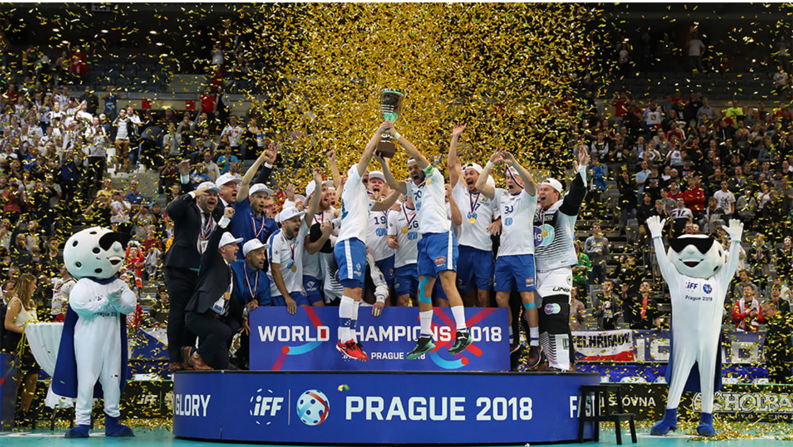
Suomen miesten salibandyjoukkue voitti maailmanmestaruuden 2018.